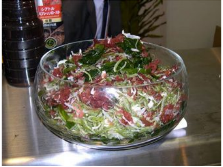
Un plato de ensalada fresca con macroalgas en Kobe, Japón.

Una propuesta japonesa por el Prof. M. Notoya y compañeros de trabajo puede tener macroalgas creciendo en balsas flotantes de 100 kilómetros cuadrados, ubicadas lejos de las rutas marítimas comerciales hasta que están listas para la cosecha, y usando mejoras artificiales de nutrientes del océano. Cada una de estas balsas gigantes posiblemente podría producir 10^6 toneladas (peso fresco) de macroalgas por año. Para igualar la producción mundial de la agricultura con macroalgas requerirá, por lo tanto, alrededor de 10.000 dichas balsas y cubrirá 1.000.000 kilómetros cuadrados de superficie oceánica, un mero 0,3 por ciento de los océanos del mundo.